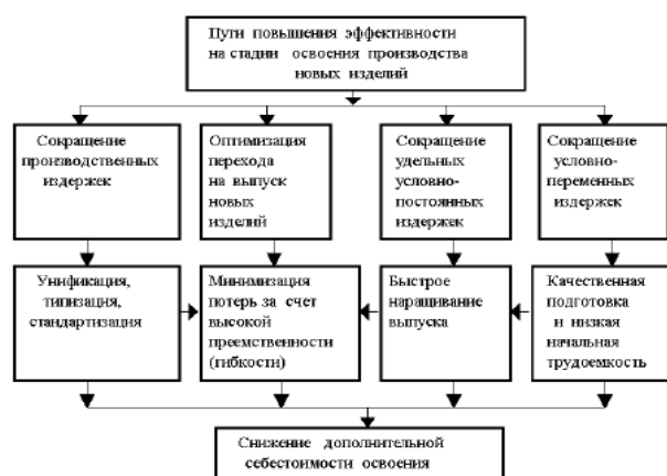
Рисунок 1.1 - Схема основных направлений получения экономического эффекта в процессе освоения новых изделий

Слово «Таблица...» указывают слева над первой частью таблицы. Над другими частями таблицы также слева пишут слова «Продолжение таблицы...» с указанием ее номера. Название при этом помещают только над первой ее частью. Допускается помещать таблицу вдоль длинной стороны листа (альбомная ориентация листа). Название таблицы оформляется сверху слева без абзацного отступа Times New Roman, не выделяя полужирным, размер шрифта - 14 пт, название таблицы приводят с прописной буквы без точки в конце. На все таблицы в ВКР (ДП (ДР)) должны быть ссылки. При ссылке следует печатать слово "таблица" с указанием ее номера. Внутри таблицы Times New Roman, размер шрифта - 12 пт, междустрочный интервал одинарный.